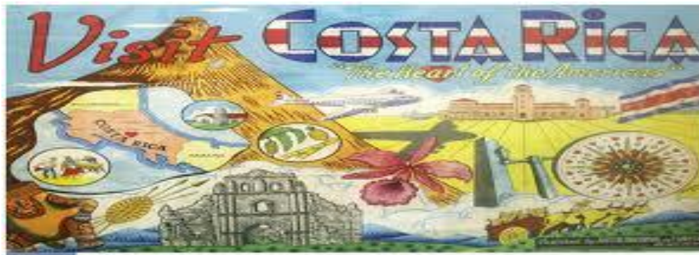
La Junta Nacional de Turismo creada en 1913 se abocó a promover la identidad cultural del país por medio de imágenes pueblerinas como la de la iglesia Colonial de Gooz.